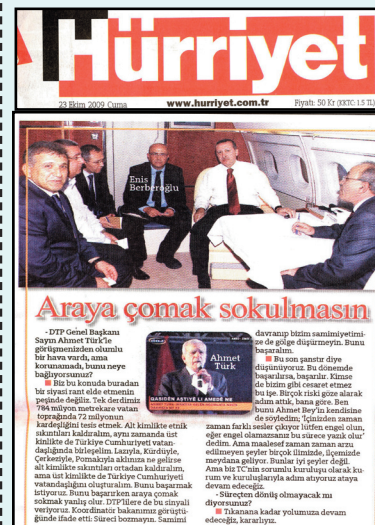
Ο Ερντογάν αναγνωρίζει τους Πομάκους. Εφημ. Χουριέτ, 21 Οκτωβρίου 2009, α.φ. 22178

Μια απίστευτη εξέλιξη ήρθε να ενισχύσει τον αγώνα των Πομάκων για την αναγνώριση της ιδιαιτερότητάς τους. Δυστυχώς, όχι από την Ελλάδα, αλλά από την Τουρκία. Ο πρωθυπουργός της χώρας που επεξεργάζεται και προωθεί την πολιτισμική γενοκτονία μας, σε δηλώσεις του στην κοινοβουλευτική ομάδα του κόμματός του αλλά και στα τουρκικά ΜΜΕ, μεταξύ των μειονοτήτων της Τουρκίας, αναγνώρισε για πρώτη φορά τους Πομάκους , ως μη Τουρκική ομάδα , η οποία μάλιστα βρίσκεται σε κατώτερο επίπεδο από την Τουρκική εθνική ομάδα. Συγκεκριμένα, δήλωσε « επιθυμούμε να άρουμε όλες τις δυσκολίες, ώστε να μην υπάρχει μέσα στην Τουρκία των 72 εκ. κατοίκων η ανώτερη εθνική ταυτότητα του Τούρκου και οι κατώτερες των Λαζών, των Κούρδων, των Κιρκασιών των Πομάκων και των άλλων ομάδων ».