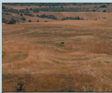
Υπολείμματα του τζαμιού της παλιάς Χρυσανγής (Σαρίγιερ)