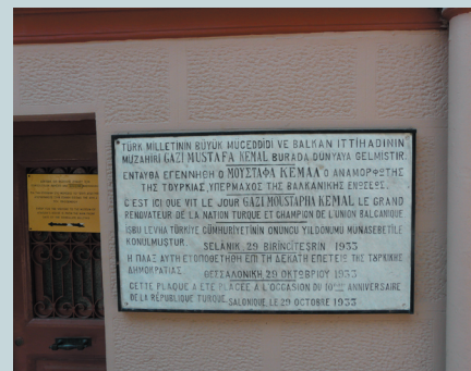
Επιγραφή που τοποθέτησε ...ευγενικός το ελληνικό κράτος