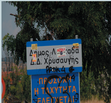
Η Χρυσανγή. Το αληθινό χωριό του Κεμάλ.

Όταν οι χριστιανοί ανατοlikοthρακιώτες πρόσφυγες πρωτοήρθαν (1922) στο Σαρίγιερ (σήμερα Χρυσανγή ), οι Τούρκοι του χωριού δεν είχαν φύγει ακόμα. Έφευγαν σταδιακά κατά ομάδες και χρειάστηκε ένας περίπου χρόνος για να φύγει και η τελευταία οικογένεια. Στο διάστημα αυτό συγκατοίκησαν χριστιανοί πρόσφυγες και ντόπιοι μουσουλμάνοι. Μάλιστα, αναπτύχθηκαν και κάποιες φιλίες παρά τις εντάσεις της εποχής. Από τους ντόπιους μουσουλμάνους κατοίκους του χωριού έμαθαν οι Έλληνες ότι, ο Κεμάλ είχε γεννηθεί στο χωριό αυτό και μέχρι περίπου οκτώ χρονών είχε μεγαλώσει εκεί. Μάλιστα, λίγα χρόνια πριν την ανταλλαγή των πληθυσμών, στην Χρυσανγή, ζούσε και η γριά μαμή που τον είχε ξεγεννήσει (η Φατμέ Χανούμ), η οποία πρέπει να πέθανε γύρω στο 1911.