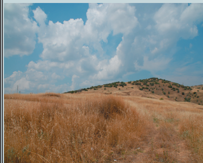
Στους λόφους αυτούς έβασκε πρόβατα και αγελάδες ο μικρός Κεμάλ.

Αργότερα άρχισαν να έρχονται και με λεωφορεία από την Τουρκία. Το