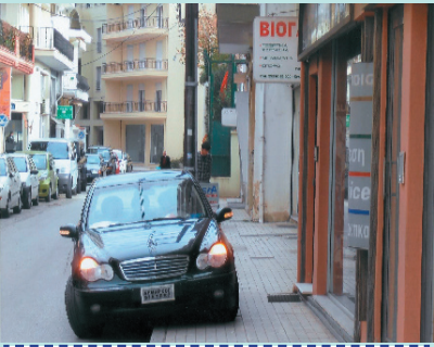
Η παράνομη στάθμευση

Στην φωτογραφία (10 Νοεμβρίου 2009, ώρα δημάρχου Φιλύρας Χασάν Κιασήφ παρκαρισμένο στο δρόμο) στην οδό Ιώνων κοντά στο Τουρκικό 71η επέτειο θανάτου του Μουσταφά Κεμάλ, υπό την σκέπη Το ερώτημα προς την τροχαία Ροδόπης είναι: Γιατί δεν σταθμά; Μήπως η οδός Ιώνων έγινε και αυτή γκρίζα ζώνη άνδρας της τροχαίας σε μηχανή και απλά έκανε πως αποφασίζουν...). Θα κάνουμε κάποια μέρα και εμείς για μία τουλάχιστον ώρα στο ίδιο και πόσο επιλεκτικά είναι τα