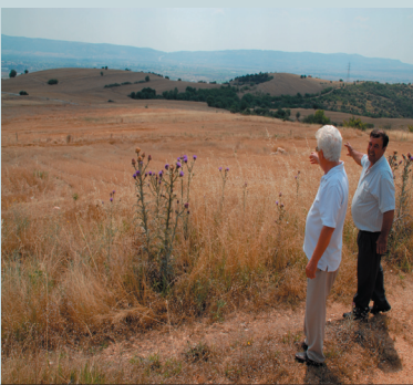
Κάτοικοι της Χρυσανγής υποδεικνύουν το μέρος όπου πραγματικά γεννήθηκε ο Κεμάλ (έχουν απομείνει μόνο θεμέλια)

Αργότερα άρχισαν να έρχονται και με λεωφορεία από την Τουρκία. Το