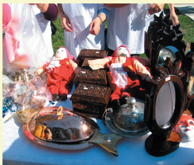
Κούκλες με τουρκικές εθνικές ενδυμασίες

Δεν σχολιάζουμε φυσικά τις δήθεν παραδοσιακές γυναικείες στολές των τουρκογενών κοριτσιών , οι οποίες καμία σχέση δεν έχουν με τις φορεσιές των τουρκογενών της Ελληνικής Θράκης, αλλά είναι μαϊμού/και αγορασμένες συνήθως από τα παζάρια της Αδριανούπολης και της Κωνσταντινούπολης... Οι πανηγυρισμοί και η έντονη προβολή ενός κατ' όνομα φιλανθρωπικού παζάρ από τον τουρκόφωνο εθνικιστικό Τύπο, αποκαλύπτει την πραγματική σημασία και τις βαθύτερες στοχεύσεις του εγχειρήματος .