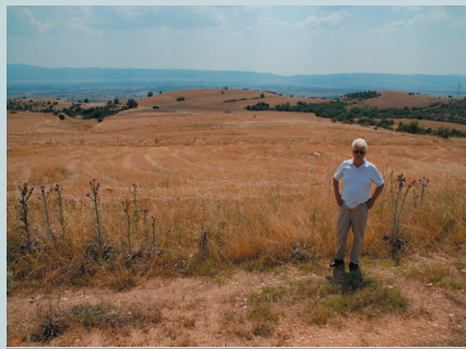
Ο σημερινός ιδιοκτήτης του οικοπέδου, όπου υπήρχε το σπίτι του Κεμάλ (Αύγουστος 2009)

Τούρκοι πρόσφυγες που έφυγαν με την Ανταλλαγή των Πληθυσμών από το παλιό Σαρίγιερ γνώριζαν την αλήθεια και παρά τα ψέματα του τουρκικού εθνικισμού, ερχόντουσαν πριν το 1981, ατομικά κυρίως, για προσκύνημα στον αληθινό τόπο γέννησης του Μουσταφά Κεμάλ . Υπήρχε μάλιστα ένας ντόπιος αγελαδάρης ο Κωνσταντίνος Γιαμουτζής , ο οποίος γνώριζε πολύ καλά την αληθινή ιστορία και αυτός συνόδευε τους επισκέπτες από την Τουρκία στο Σαρίγιερ και τους έδειχνε τα ερείπια του σπιτιού.