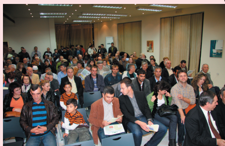
Αποψη του ακροατηρίου