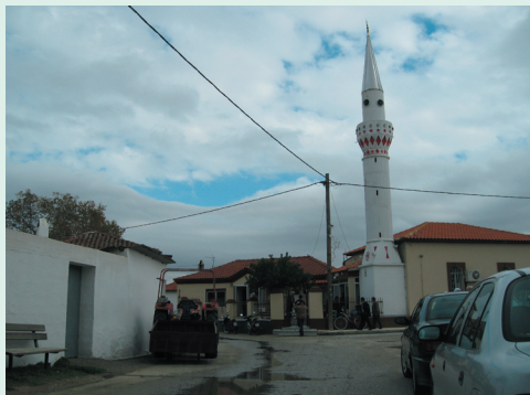
Το τζαμί του Κικιδίου

Νέα ρατσιστική επίθεση σε βάρος οικογένειας Πομάκων που μένουν στον οικισμό Κικίδιο του ν. Ροδόπης. Σύμφωνα με την εφημερίδα Χρόνος (13/10/09, α.φ.12278) τα δίδυμα παιδιά οικογένειας μουσουλμάνων αποκάλυψαν ένα μικρό αγόρι Πομακικής καταγωγής « παλιοπομάκο! » και άρχισαν να του πετάνε πέτρες. Όταν ο πατέρας του μικρού Πομάκου ζήτησε κάποια στιγμή εξηγήσεις, τότε οι γονείς των διδύμων του επιτέθηκαν και άρχισαν να τον χτυπάνε. Στο σημείο του καβγά έσπευσε ο θεός του Πομάκου ο οποίος μαζί με τον πατέρα του παιδιού, μαχαίρώθηκαν από τον μουσουλμάνο. Ευτυχώς τα τραύματα δεν στάθηκαν σοβαρά και οι δύο άντρες πομακικής καταγωγής νοσηλεύθηκαν εκτός κινδύνου στο νοσοκομείο Κομοτηνής.