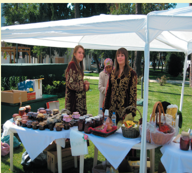
Δήθεν παραδοσιακές στολές της Θράκης...

Και γιατί εμάς τους Πομάκους να μας νοιάζει τι κάνει η νομαρχία Ροδόπης και αν συναλλάσσεται και πώς με τον Κεμαλισμό; Μας ενδιαφέρει, διότι χωρίς ντροπή και με πραγματική γενοκτονική ανθράδα σε δύο από τα σημεία πώλησης παρουσιαζόταν Πομάκικα ταγάρια και υφαντά της ορεινής Ροδόπης ως τουρκικά καλλιτεχνήματα . Αυτό είναι αίσχος και ντροπή σε όσους με τον τρόπο τους ενισχύουν την Πομακική πολιτισμική γενοκτονία . Ντροπή σε όσους δεν αντιδρούν, στις γενοκτονικές πρακτικές τις οποίες προβάλλουν ως παραδείγματα ... συνύπαρξης και τις επαινούν δημόσια. Ντροπή να εμφανίζουν σε ένα ...φιλανθρωπικό παζάρι μέσα στο κέντρο της Κομοτηνής και να πουλούν φωτογραφίες του γενοκτόνου Μουσταφά Κεμάλ (Ατατούρκ) . Ντροπή να πουλούν ακόμα και κούκλες από το παζάρι της Αδριανούπολης με τουρκικές εθνικές ενδυμασίες . Τι άλλο πρέπει να πουλήσουν μέσα στο πάρκο της Κομοτηνής με τις ευλογίες της Ελληνικής υπερ-νομαρχίας, νομαρχίας και δήμου Κομοτηνής; Απέμεινε ίχνος ευαισθησίας σε αυτό τον τόπο;