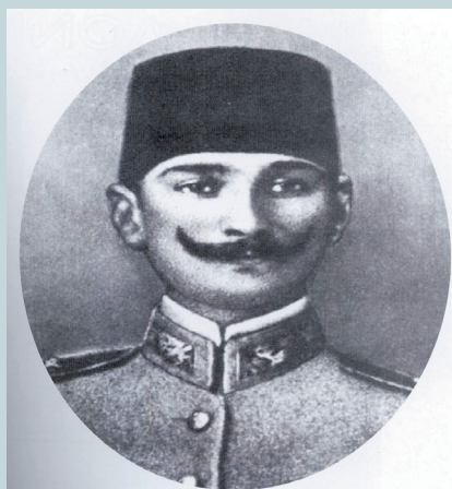
Ο Κεμάλ λοχαγός, 1905

Η Ζαγάλιστα αποκαλύπτει σήμερα μετά από προσεκτική επιτόπια έρευνα πολλών μηνών, ότι ο ισχυρισμός της γέννησης του Μουσταφά Κεμάλ (Ατατούρκ) στη Θεσσαλονίκη είναι ένα μεγάλο και ωραίο ΠΑΡΑΜΥΘΙ, για να κοροϊδεύουν οι Τούρκοι τους εαυτούς τους, αλλά και πολλούς μουσουλμάνους από τη Θράκη. Μάλιστα, τα τελευταία χρόνια προσπαθώντας να τονώσουν το εθνικό φρόνημα, έχει δοθεί «γραμμή», ώστε οποιοδήποτε τουριστικό γκρουπ «Τούρκων» της Ελληνικής Θράκης αποτελούμενο από πολιτιστικούς συλλόγους και κυρίως δημοτικά σχολεία, επισκέπτεται τη Θεσσαλονίκη, να πηγαίνει συμβολικά πρώτα στο ...σπίτι του Κεμάλ και μετά οπουδήποτε αλλού. Για τον τουρκικό εθνικισμό το ιστορικότερο αξιοθέατο της Θεσσαλονίκης είναι το ...σπίτι του Μουσταφά Κεμάλ!