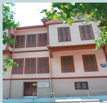
Το ... ρος σπίτι του Κεμάλ, ή καλύτερα της ...Μπάρμπι!