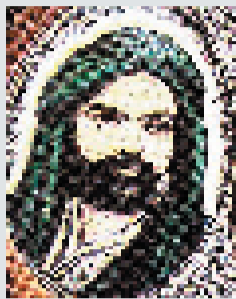
Ο προφήτης Αλή

Ύπουλο πόλεμο κατά των Αλεβητών έχει κηρύξει εδώ και χρόνια το Τουρκικό κράτος. Η νέα πονηριά του κράτους, είναι η πρόταση να δίνει μισθό στους θρησκευτικούς λειτουργούς των Αλεβιτών, στους Ντεντέδες. Όμως οι ίδιοι αντέδρασαν αμέσως. Όπως γράφει η εφημ ZAMAN (30.11.2008) συνεδρίασαν οι επικεφαλής των Ντεντέδων στο Πολιτιστικό Κέντρο ΧΑΤΖΗ ΜΠΕΚΤΑΣ ΒΕΛΗ και αποφάσισαν να απορρίψουν την πρόταση του Τουρκικού κράτους, λέγοντας μάλιστα ότι η Μισθοδοσία των Ντεντέδων είναι Προδοσία κατά των Αλεβιτών . Ειδικότερα ο πνευματικός τους αρχηγός Βελιγεντίν Ουλούσοϊ, δήλωσε «Το κράτος καλά θα κάνει να μας αναγνωρίσει ως ισότιμους με τους Σουνίτες. Με τη μισθοδοσία προσπαθούν να κάνουν τους Ντεντέδες όργανα του Τουρκικού κράτους. Το Τουρκικό κράτος θέλει να ιδρύσει ένα δικό του και απόλυτα ελεγχόμενο Αλεβιτισμό.»