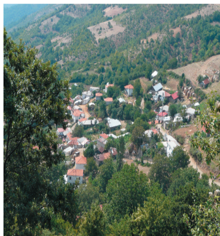
Πανοραμική άποψη της Κύμης