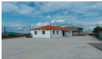
Μειονοτικό σχολείο στο ν. Έβρου

ούτε ατατουρκισμούς ούτε ξένη γλώσσα για μητρική. Θέλουμε ίσες ευκαιρίες στην εκπαίδευση και ίσες ευκαιρίες για επαγγελματική αποκατάσταση. Αυτά είναι τα πραγματικά μας ανθρώπινα δικαιώματα που στερούμαστε. Εργασία, γλώσσα, ελευθερία.