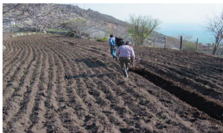
Δε χρειάζεται να ξέρεις τουρκικά για να οργώνεις το χωράφι